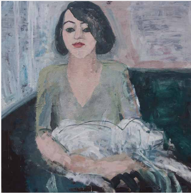
Luisa mit Fiffchen · 100 x 100 cm · Öl-Mischtechnik auf Leinwand · 2008