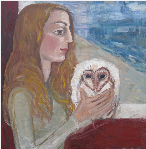
Amelie mit Schleiereule · 100 x 100 cm · Öl-Mischtechnik auf Leinwand · 2008