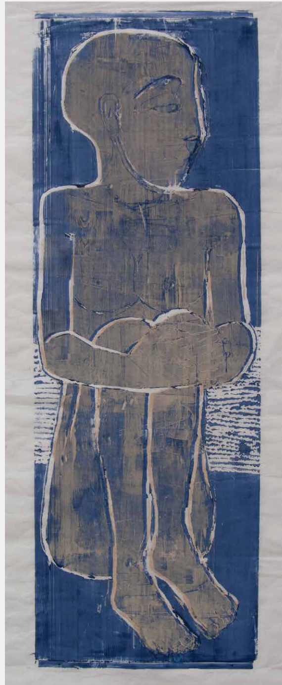
Hockende · 150 x 51 cm · Holzschnitt auf Chinapapier · Einzelhandabzug